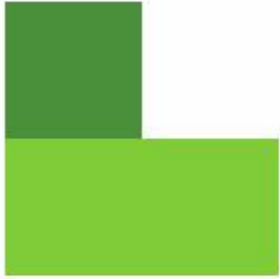
Tabel 1: Onderwijs in Utrecht (stad) 1